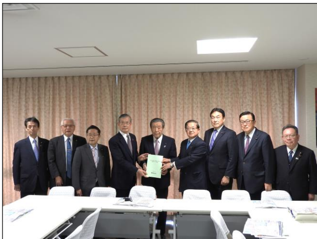
森山自民党幹事長との面談