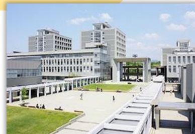
愛知県立大学・長久手キャンパス