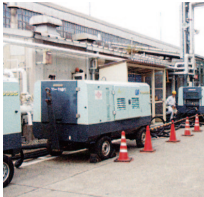
停電時の緊急対応でのエンジンコンプレッサー