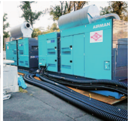
工事期間中の万が一に備えた非常用発電機