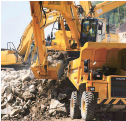
第二東名建設工事での重機

近郊のヤードに保有機械を集中させることで、大量ロットや特殊機械の出荷をスピーディーにできることが弊社の強みです。今後も社会の変化に対応しながら中部地区No.1のラインナップで、全社員が一丸となってお客様を支えています。