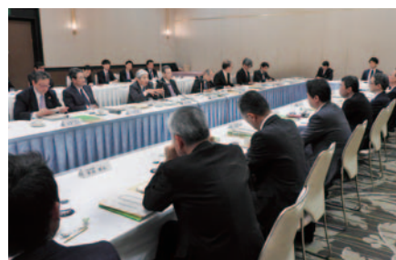
三重県にて開催した地域産業活性化委員会および 地域会員懇談会(P8)