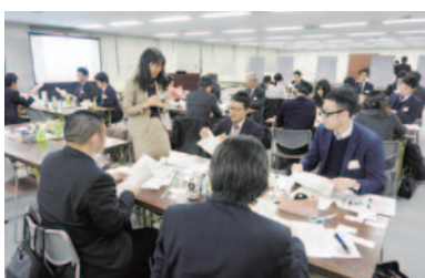
第37回Next30産学フォーラム(P11)