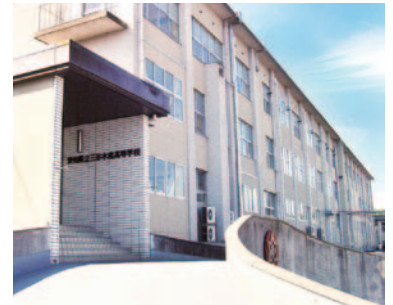
三谷水産高等学校 設立:1940年 生徒数:469人 学科:海洋科学科、情報通信科、 海洋資源科、水産食品科

学校だ。2016年には、地元企業との協業による新商品の開発やマルチコプタ(ドローン)による海洋調査など、多くの先進的活動が評価され、文部科学省からスーパー・プロフェッショナル・ハイスクール*の指定も受けており、その独自の取り組みに惹かれ、全国から生徒が集まってきている。