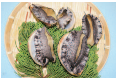
陸上養殖で育てたアワビ

現在の主流である海上養殖には、台風や赤潮といった自然現象の影響による安定出荷に対するリスクがある。そのため陸上養殖には、こうしたリスクを回避し、安定的な供給を実現できる新たな産業として、大きな期待が寄せられている。