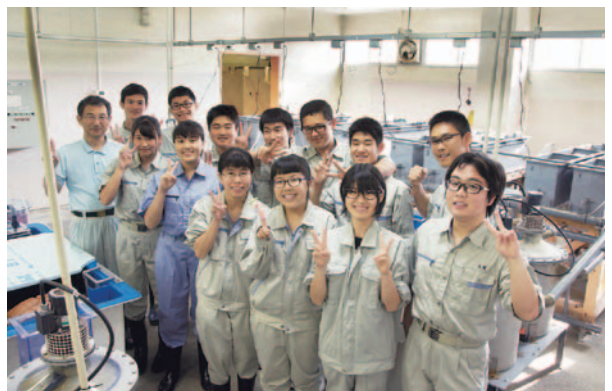
養殖を手掛ける増殖部の生徒たち

近い将来、蒲郡の新たな名産品として、おいしいアワビが全国の食卓に上ることを期待したい。