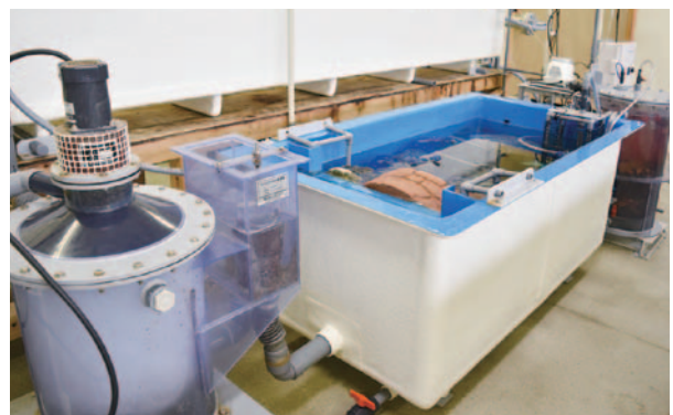
水質浄化システム

同校が取り組んでいる養殖の大きな特徴の一つが、「完全閉鎖循環式養殖」だ。これは人工海水をろ過して循環する環境で魚介類を育成する方式で、水と電気があれば場所を選ばず養殖できる。